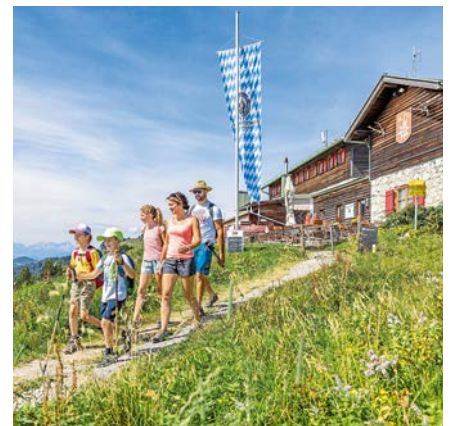
Wandern am Brauneck