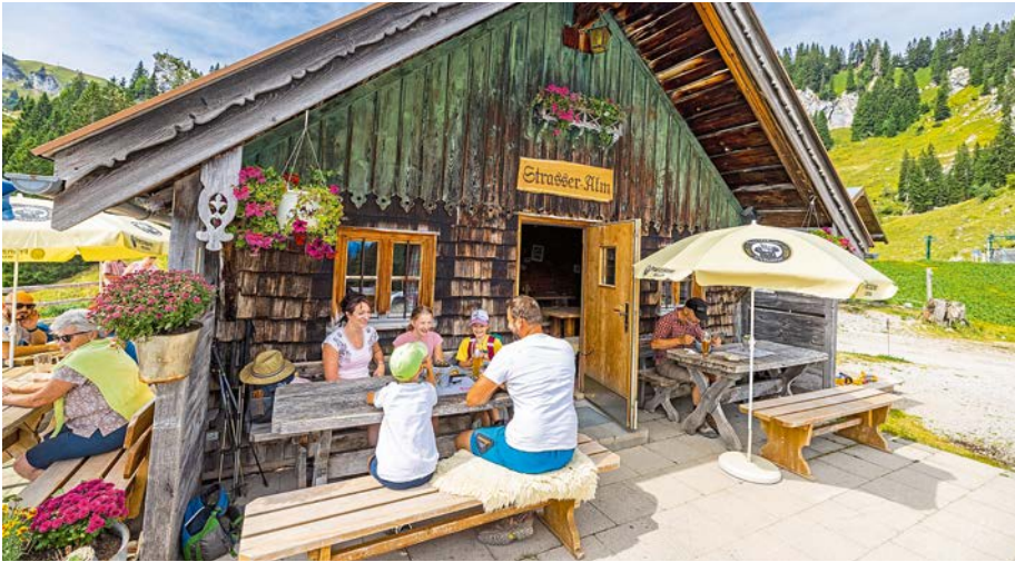
Pause auf der Strasser-Alm am Brauneck