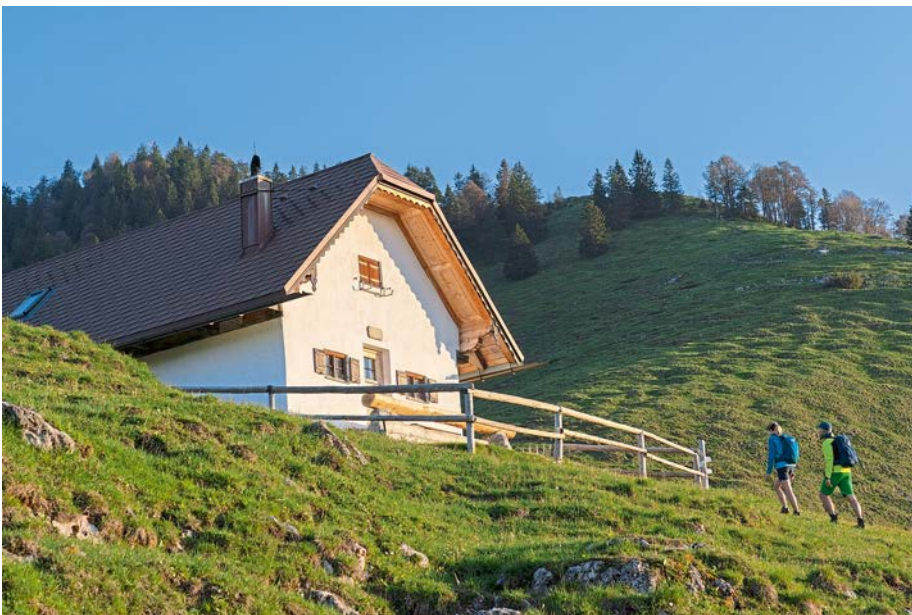
Staffelalm am Rabenkopf