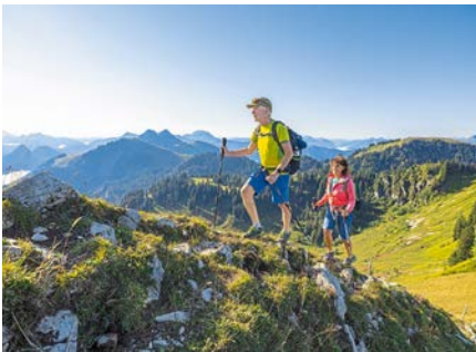
Wandern am Seekarkreuz